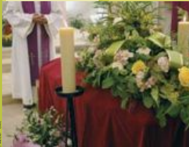
C. Mercier - CIRC