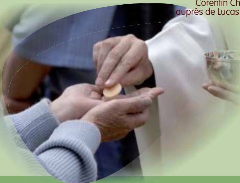
A. Pirroges - CIRC